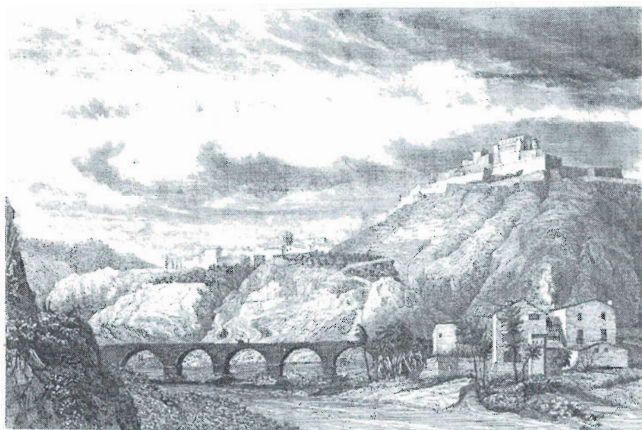
A dalt: el nou diner de Cardona a mida real i molt ampliat. A baix: gravat d'Antoni Roca publicat el 1842 que representa el poble i el castell de Cardona (F. Pi i Margall, España, obra pintoresca ).